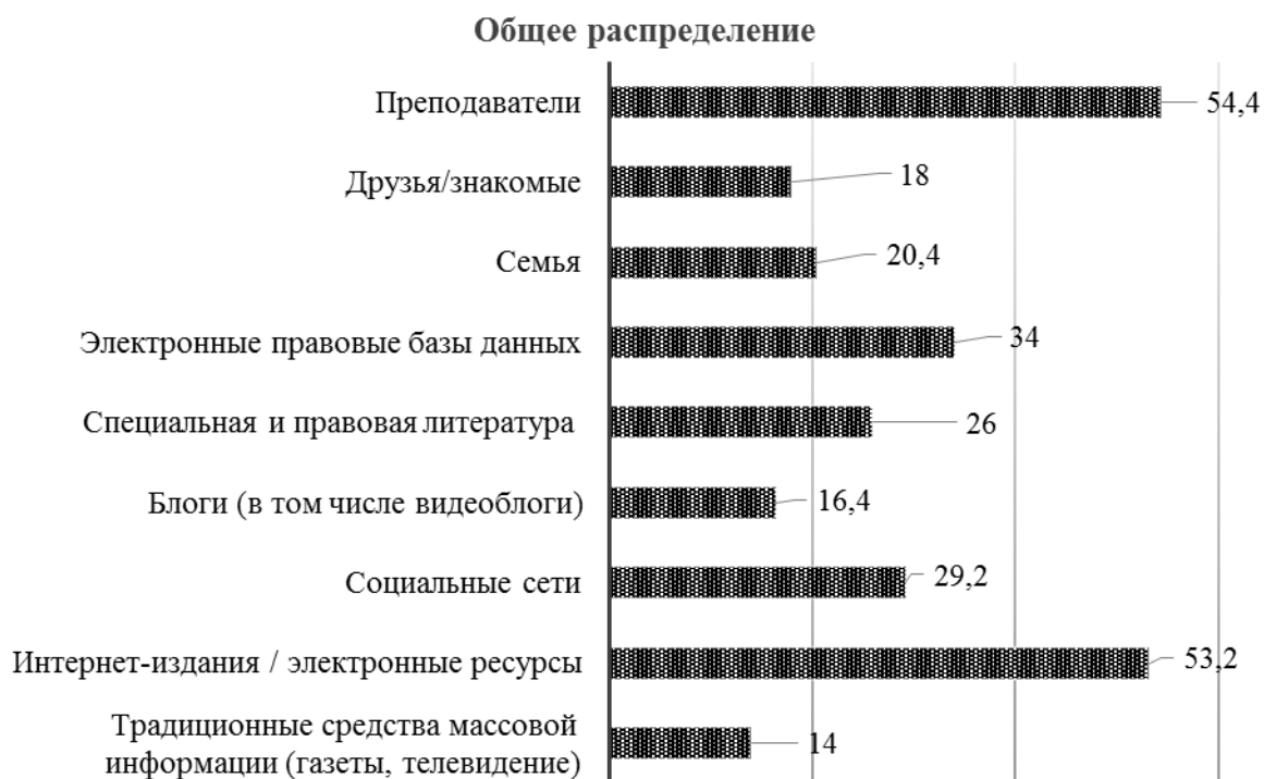
Рис. 2. Распределение ответов на вопрос: «Отметьте основные источники, из которых Вы получаете правовую информацию», в процентах*

преподаватели, учителя и кураторы внесли значимый вклад в их правовое образование. Это подчеркивает необходимость сохранения в рамках системы образования специальных правовых курсов и предметов.